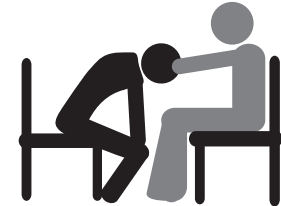
DARSHAN CON SILLA

Puedes recibir el Darshan sentado en una silla • Avisa a un voluntario • Sientate en la zona reservada para asistencia con silla.